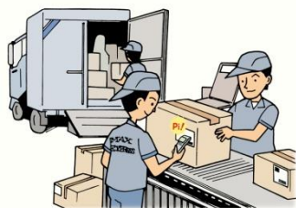
出荷前の読取りチェック