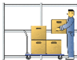
個品へのバーコード貼り （コピー発行）