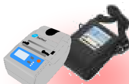
モバイルプリンター